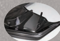
フルカーボン / ハードカーボン